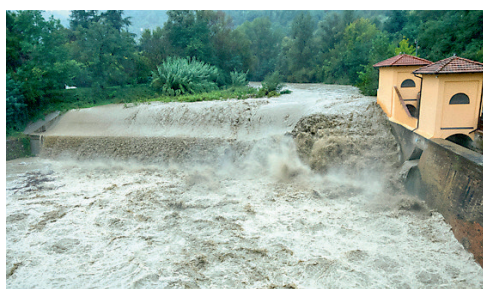
▲ La furia dell'acqua