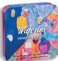
WAFERINI CACAO E VANIGLIA EDIZIONE LIMITATA € 18,00 190 gr