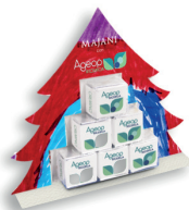
ALBERO CON CREMINI MAJANI € 7,00 61 gr