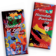
TAVOLETTE CIOCCOLATO LATTE E NOCCIOLE O FONDENTE 75% € 5,00 100 gr