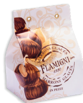
MARRONS GLACÉS IN PEZZI € 15,00 300 gr