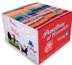
PANETTONE GOCCE DI CIOCCOLATO € 25,00 1000 gr