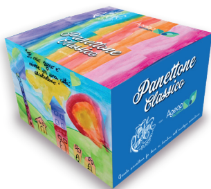
PANETTONE CLASSICO € 20,00 1000 gr