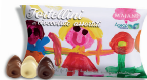
POCHETTE TORTELLINI DI CIOCCOLATO ASSORTITI € 12,00 110 gr