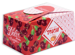
DOLCE AMARENA TOSCHI € 12,00 300 gr