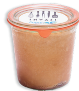
BABÀ AL RUM € 15,00 300 gr