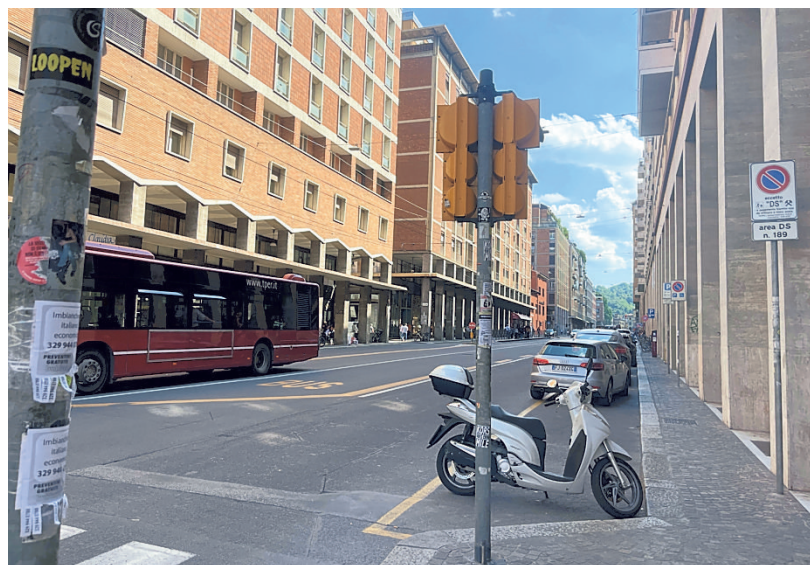
▲ Il luogo Via Marconi, in questo punto c'è stato lo scontro

Si è presentato spontaneamente nella sede della polizia locale per dire che a provocare l'incidente di mercoledì sera in via Marconi, in cui una ragazza di 23 anni è rimasta gravemente ferita, è stato lui. Si tratta di un diciottenne che, verso le 21, era in sella al suo scooter quando, all'altezza del civico 26 ha urtato di lato la bici presa a noleggio della giovane. Che è caduta a terra, sbattendo la testa e procurandosi un trauma serio. La ragazza era stata ricoverata al Maggiore, in condizioni che inizialmente sembravano disperate. Ma ora, fanno sapere fonti mediche, è in miglioramento: dopo essere stata trasferita dalla terapia intensiva a quella semintensiva, ieri le sono stati dati due mesi di prognosi. Sulle prime la dinamica dell'incidente non era chiara, visto che non c'era nessun testimone. Nella giornata di giovedì in quartiere erano però circolate voci di uno scooter nero che, superando la ciclista da dietro, l'aveva urtata di lato. Ma si trattava di una versione riportata da terzi, che inizialmente non