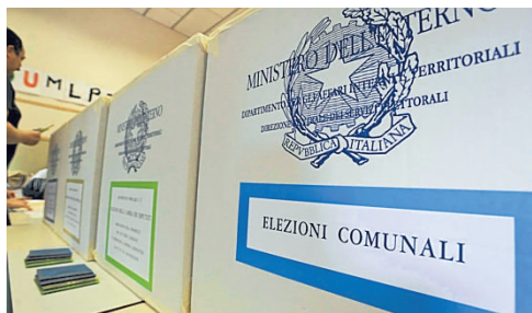
● a pagina 4 ▲ Si vota oggi (15-23) e domani (7-23)

Oggi, dalle 15 alle 23, domani, dalle 7 alle 23, urne aperte in Emilia-Romagna per eleggere 15 eurodeputati, 225 sindaci e 3.026 consiglieri comunali. Prima volta al voto per 192mila maggiorenti alle Europee e 39mila alle Amministrative. I partiti di governo e di opposizione pronti a confrontare i loro risultati con quelli delle politiche del 2022. Sia per l'Emilia-Romagna, che leggerà nei risultati per Bruxelles la prova generale verso le Regionali d'autunno, per eleggere il nuovo presidente della Regione.