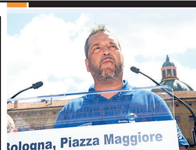
Bologna, Piazza Maggiore