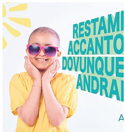
▲ Il manifesto dell'iniziativa Per i bimbi di Oncologia

C'è chi farà in bicicletta migliaia di chilometri e chi invece prenderà un aperitivo, con tanto di accompagnamento musicale. Tutti, comunque, contribuiranno alla raccolta fondi per l'Ageop, perché anche d'estate le cure per i piccoli pazienti malati di cancro non possono andare in vacanza. Anche con l'arrivo dell'estate, il reparto Lalla Seragnoli di Oncoematologia del Policlinico Sant'Orsola non si svuoterà, rimarranno ricoverati i bimbi che devono curarsi e le loro famiglie saranno nelle case di accoglienza messe a disposizione dall'Ageop. Anche da giugno a settembre, l'associazione deve dare continuità all'impegno che garantisce la presenza di 4 medici, 5 biologi e 4 psicologhe, un supporto che assicura non solo la ricerca, ma anche la presenza di medici in reparto. Le malattie non vanno in vacanza e per questo motivo l'associazione deve provvedere anche nei mesi estivi a portare la spe-